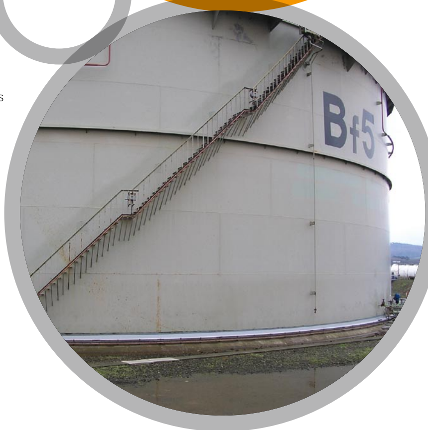
Réservoirs de produits chimiques