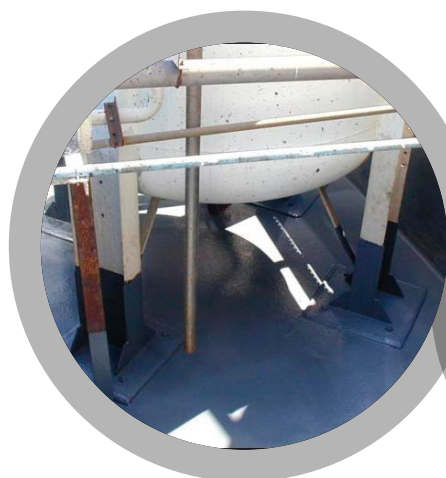
Zones de confinement chimique