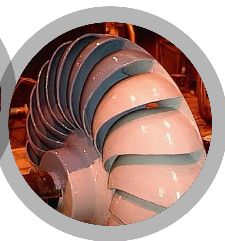
Roues de turbine