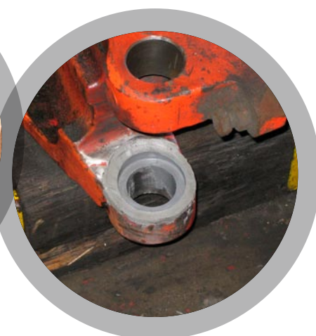
Remise en place de butées