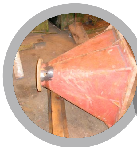
Étanchéité de trémies fuyantes