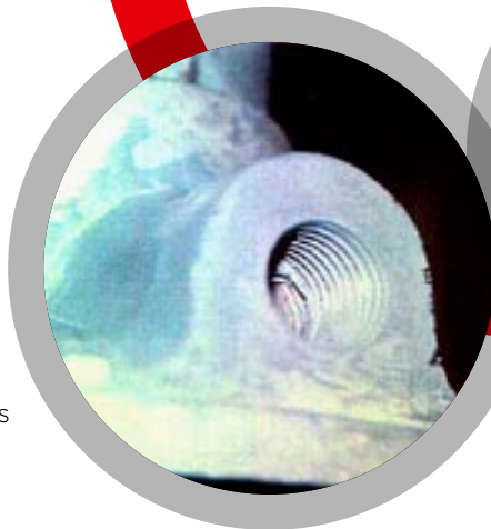
Reformage de filetages arrachés