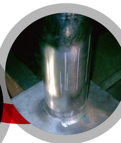
Reconstruction de vérins rayés