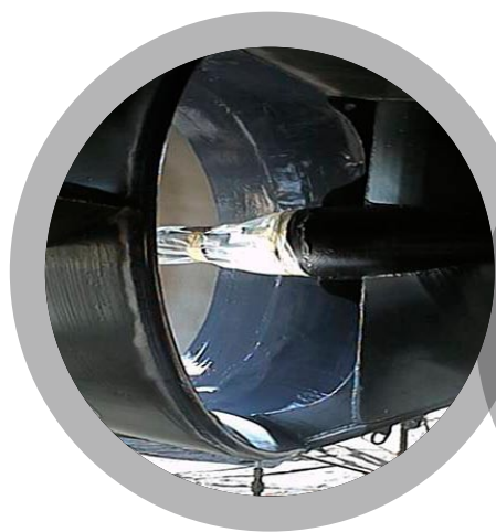
Tuyères de Kort