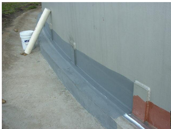
Application du primaire d'accrochage

SOLUTION : mise en œuvre du système d'étanchéité Membrane Flexible BELZONA