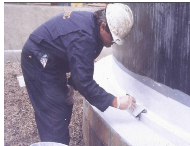
Application de la deuxième couche de finition