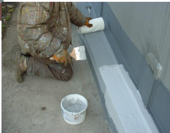
Application de la première couche de Membrane avec filet de renforcement